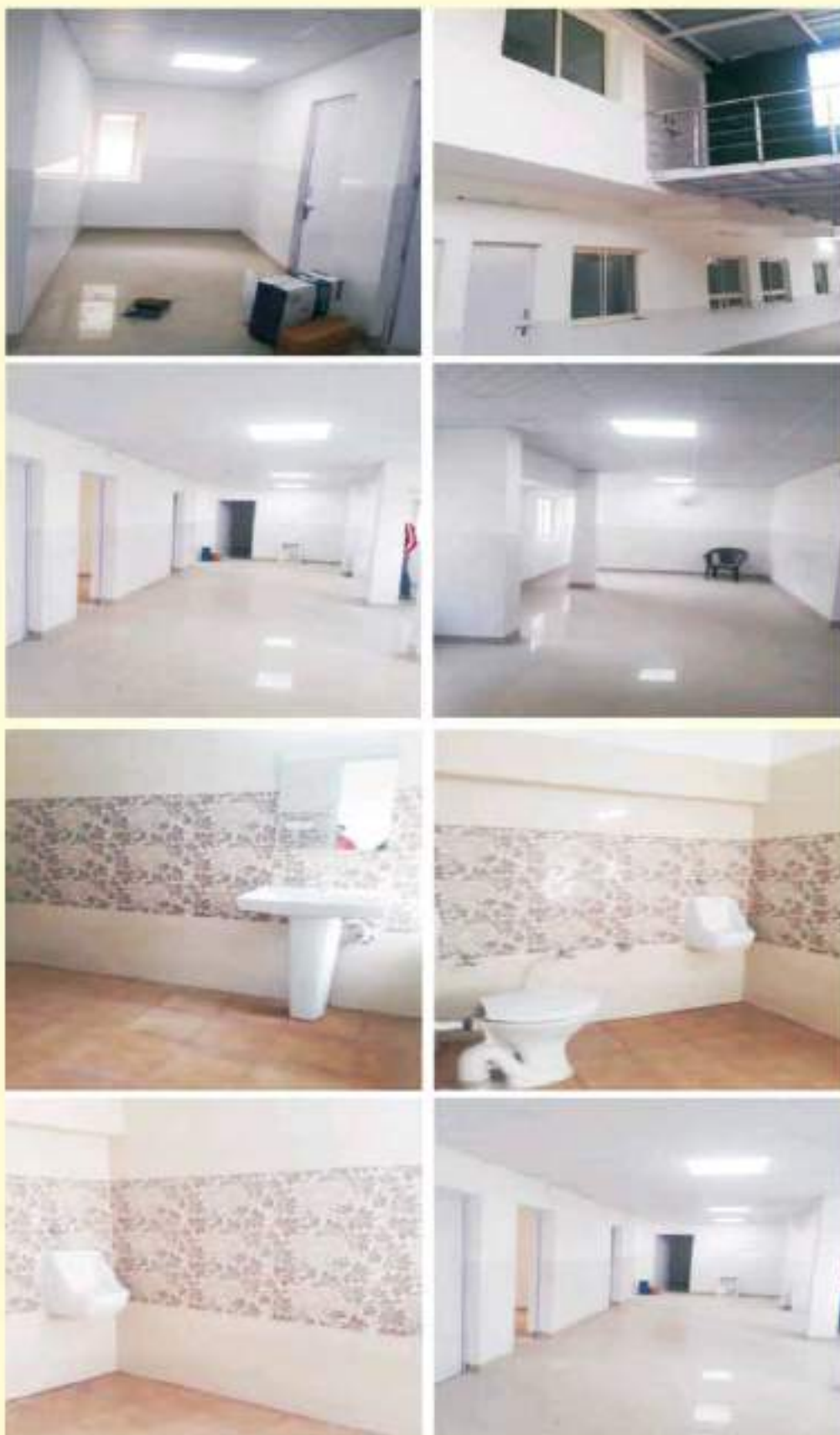
नरेला आउटर-नॉर्थ डिस्ट्रिक्ट में सीजीएचएस डिस्पेंसरी का नवीनीकरण और उन्नयन कार्य दिपुआनिलि द्वारा किया गया। Renovation & upgradation work of CGHS Dispensary at Narela Outer-North Distt. Completed by DPHCL