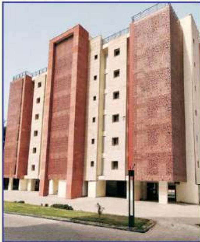
दिपुआनिलि द्वारा नया पुलिस मुख्यालय आवासीय परिसर में बालकनी पर व्यू-कटर स्थापित किया Installation of View-Cutter at balcony in the New PHQ Residential Complex by DPHCL