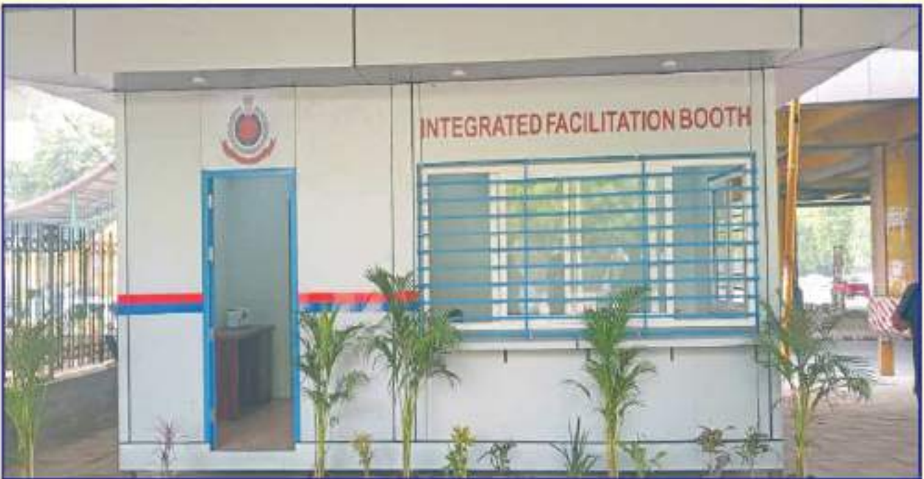
एकीकृत सुविधा बूथ का डिजाइन एवं विकास दिपुआनिलि द्वारा किया गया Integrated Facilitation Booth Design & Developed by DPHCL