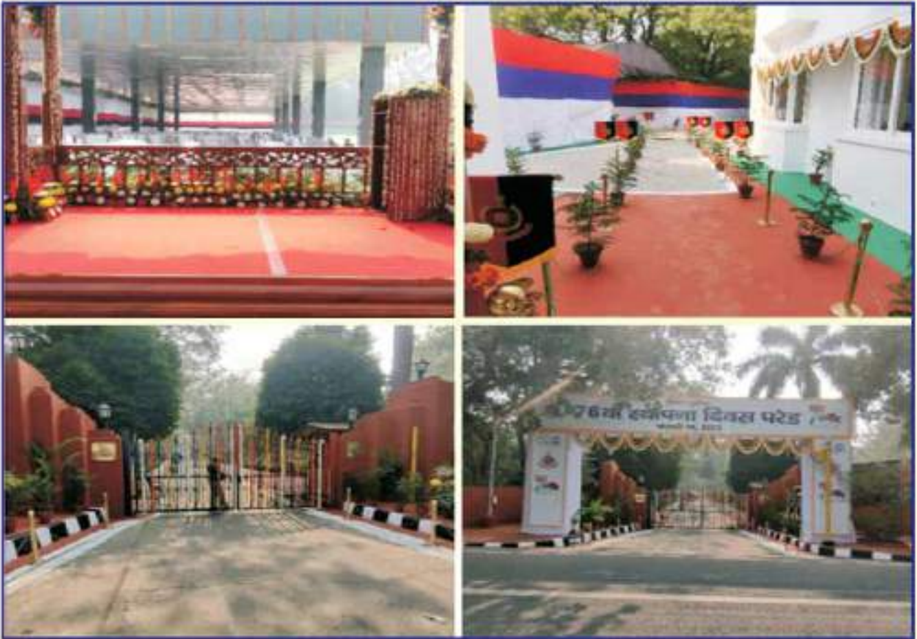
दिल्ली पुलिस स्थापना दिवस परेड के उपलक्ष में सौन्दर्यकरण का कार्य दिपुआनिलि के द्वारा सम्पन्न किया गया। On the occasion of Delhi Police Foundation Day Parade, the work of decorated was completed by DPHCL